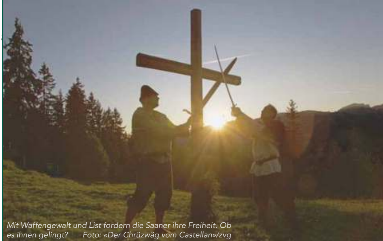
Mit Waffengewalt und List fordern die Saaner ihre Freiheit. Ob es ihnen gelingt?