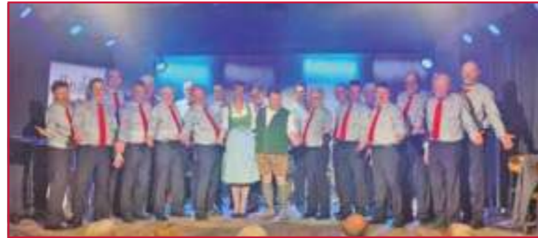
Härzbluet Wattenwil-Bangerten im April 2024 zusammen mit Besuch aus dem Südtirol.

Anlässlich unseres 100-jährigen Jubiläums haben wir uns nicht nur für unsere Sänger einen neuen Look geleistet, sondern auch dem Verein ein völlig neues Outfit verpasst. Ein Outfit, welches in einem Wort perfekt beschreibt, wofür wir stehen, wer wir sind und was uns antreibt. Ab sofort sind wir unter dem Namen «Härzbluet Wattenwil-Bangerten» unterwegs. Doch keine Sorge, die stolze Tradition unseres Chores bleibt unberührt, während wir gleichzeitig gewohnt neue Wege beschreiten. Trotz des frischen Anstrichs bleibt Härzbluet auch ein Wächter des traditionellen Liedguts. Unsere Stimmen tragen weiterhin die harmonischen Melodien vergangener Tage, die das Herz berühren. Doch wie ein Chamäleon, das sich den Gegebenheiten anpasst, scheuen wir auch in Zukunft nicht davor zurück, auch moderne Töne anzuschlagen. Denn Tradition pflegen heisst nicht «Asche bewahren». Es heisst «Flamme weitergeben». In diesem Sinne: