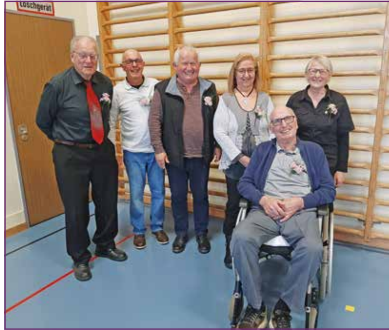
Die Sängerinnen und Sänger konnten für 35, 40, 50 oder 60 Jahre Singen im Chor geehrt werden.